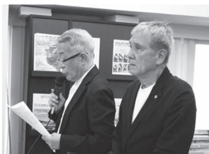
小玉監事、新任三国監事