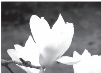
「ハクモクレン」 神代植物園 遠藤 勇