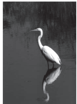
「大サギ」 埼玉県カスミ川 茂木 登