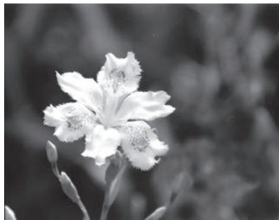
「早春のヒメシヤガ」 新宿御苑 金井正行