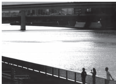
「足立区扇橋付近」 足立区荒川 小泉利明