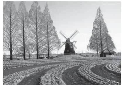
「のどかな春景色」 あけぼの農業公園(千葉県柏) 尾崎和江