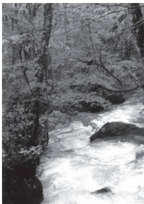
「奥入瀬溪流」 青森県 市川 修