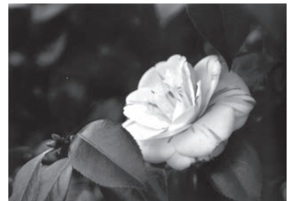
「椿」 神代植物園 遠藤久子