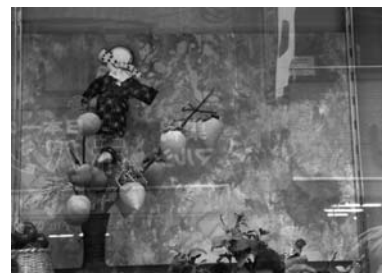
2位 茂木 登 「巣鴨のウィンドー」