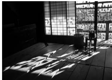
3位 尾崎和江 「冬の華やぎ」