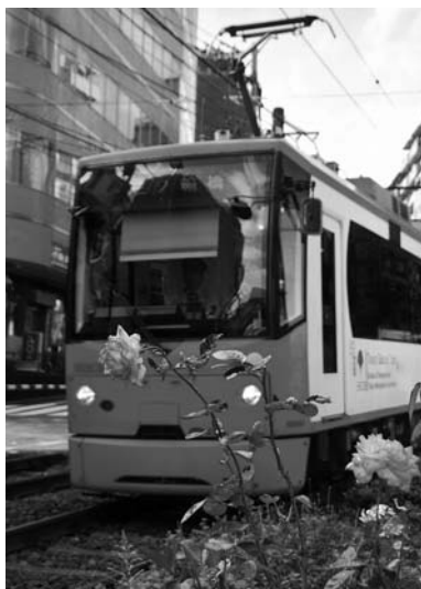
1位 尾崎和江 「バラと都電」