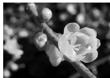
3位 尾崎和江 「冬の色どり」