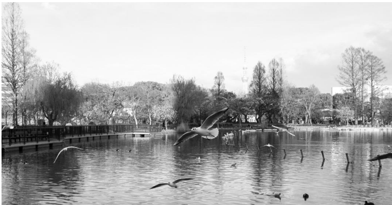
【新型コロナウイルス緊急事態宣言直後の上野不忍池】 都技広報部