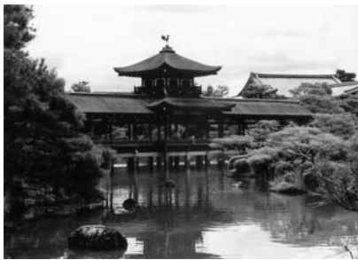
「漆黒の神社」 京都 平安神宮 西村佳江子