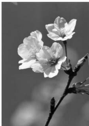
「快晴の空に桜花」 新宿御苑 金井正行