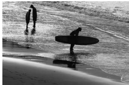
「サーファー」 南伊豆 荒居政一