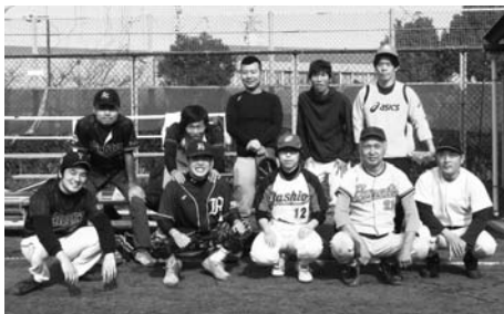
昨年優勝の文京・大田チーム