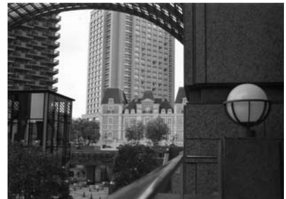
「恵比寿の街角」 恵比寿 尾崎和江