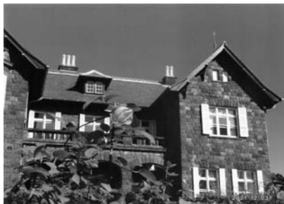
「凜として」 旧古河庭園 市川 修