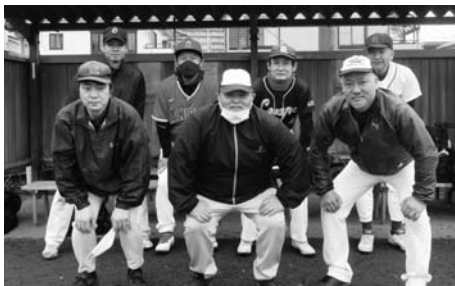
昨年優勝の江東チーム