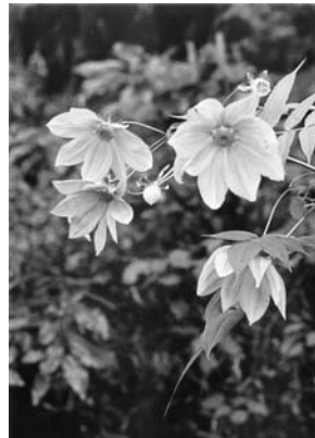
「皇帝ダリア」 鎌倉 瑞泉寺 遠藤 勇