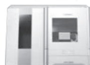
DWX-52DC 一般医療機器 医療機器届出番号 22B3X1006000022