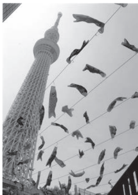
「五月の風物詩」 東京スカイツリー 尾崎和江