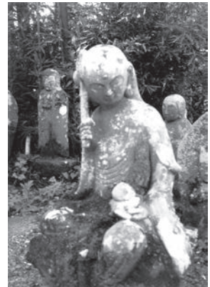
「秩父観音めぐり」 第4香 金昌寺 市川 修