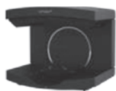
松風S-WAVEスキャナー E3 一般医療機器 医療機器届出番号 26B1X00004000244